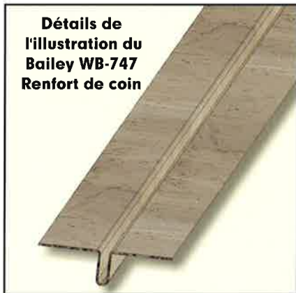
Détails de l'illustration du Bailey WB-747 Renfort de coin